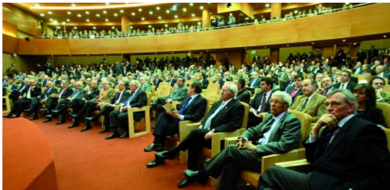
La flor y nata de la sociedad civil se reunió en el IESE para reclamar la descentralización de la gestión del aeropuerto de El Prat

El pasado 22 de marzo, la sala de actos del IESE de Barcelona acogió un acto unitario como pocas veces se ha visto. La llamada sociedad civil catalana se reunió con un claro objetivo: que el aeropuerto de El Prat, que está en plena ampliación, se gestione de manera descentralizada y consiga nuevos enlaces internacionales.