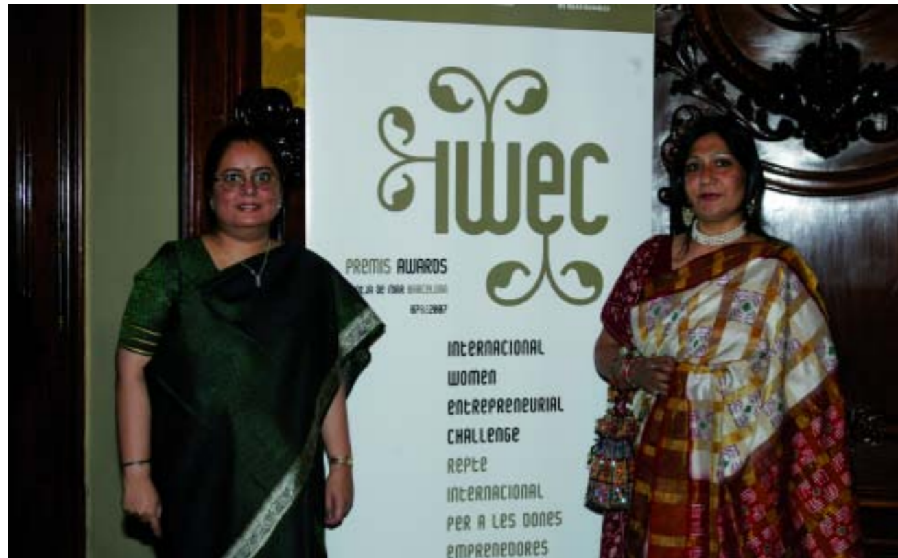
Dos de las galardonadas poco antes de recoger el premio

La India es, por méritos propios, "el otro" gigante asiático. Y aunque las relaciones bilaterales con España son, si cabe, inferiores a las que se mantienen desde la Península con China, éstas tienen un enorme potencial. De ahí la importancia de iniciativas como la que se acaba de poner en marcha este mismo año.