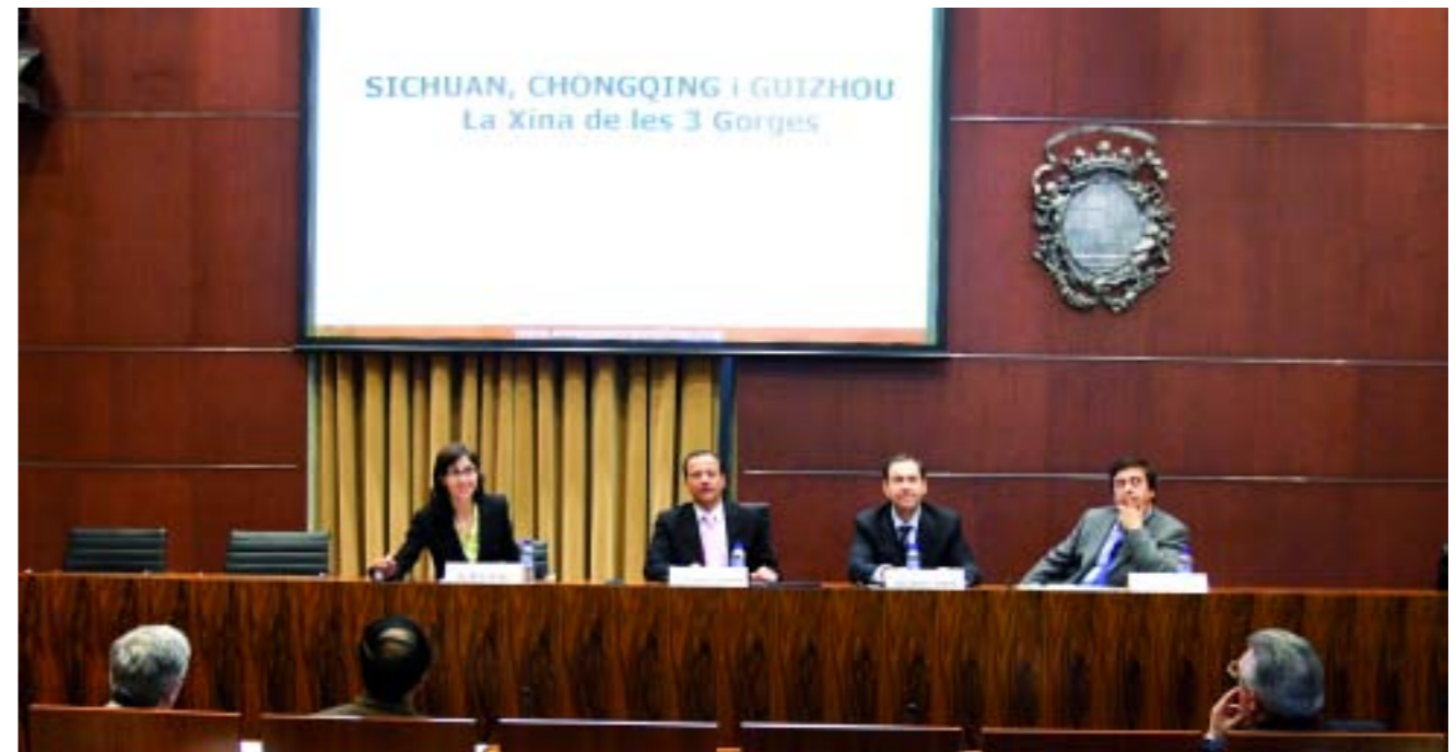
Con este estudio sobre las tres gargantas, la Cámara de Barcelona cierra un ciclo sobre la realidad y las oportunidades de negocio en China